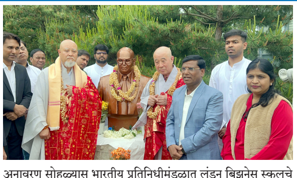
अनावरण सोहळ्यास भारतीय प्रतिनिधीमंडळात लंडन बिझनेस स्कूलचे

बीड । प्रतिनिधी कोरियन परंपरेप्रमाणे बुद्ध जन्मदिन १५ मे रोजी साजरी करण्यात येतो (कोरियन लुनार कॅलेंडर नुसार) या दिनाचे औचित्य साधून एका ऐतिहासिक घटनेत दक्षिण कोरिया येथील बुद्ध विहारामध्ये डॉ.बी.आर.आंबेडकर यांचा पहिला पुतळा अनावरण केला आहे. डॉ.बी.आर.आंबेडकर हे एक प्रसिद्ध भारतीय न्यायविद, अर्थशास्त्रज्ञ आणि समाज सुधारक होते. त्यांनी भारतात बौद्ध धर्माच्या पुनरुज्जीवनात महत्त्वपूर्ण भूमिका बजावली आहे.